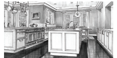
عازل للمطابخ Kitchens Waterproofing