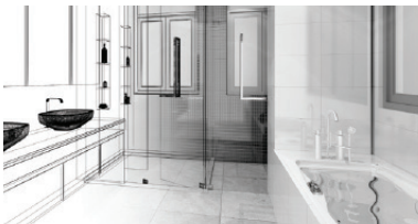
عازل للحمامات Bathrooms Waterproofing