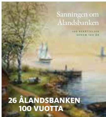
26 ÅLANDSBANKEN 100 VUOTTA