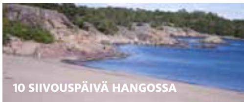
10 SIIVOUSPÄIVÄ HANGOSSA