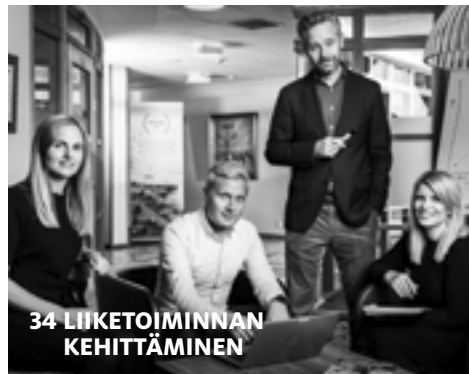
34 LIIKETOIMINNAN KEHITTÄMINEN

Ålandsbanking-lehden julkaisee: Ålandsbanken, Bulevardi 3, 00120 Helsinki Puhelin Helsinki 0204 293 600, Tampere 0204 293 200, Vaasa 0204 293 300, Turku 0204 293 100, Parainen 0204 293 150 Sähköposti alandsbanking@alandsbanken.fi Vastaava julkaisija Anne-Maria Salenius Päätoimittaja Jenny Ruda Layout Andreas Johansson, Erik Larsson Painotalo NogaGruppen/Reusner, painettu ympäristöä säästävälle paperille