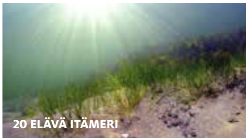
20 ELÄVÄ ITÄMERI