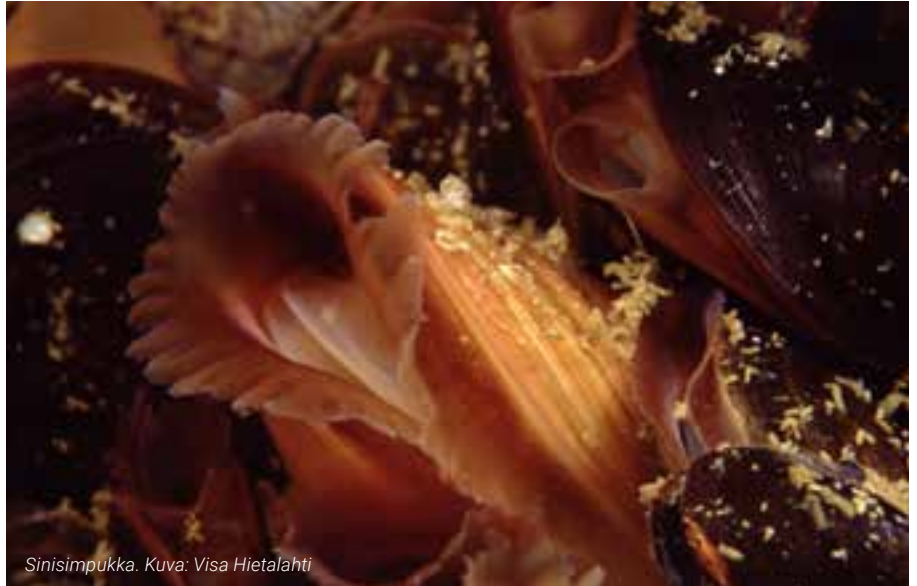
Sinisimpukka.