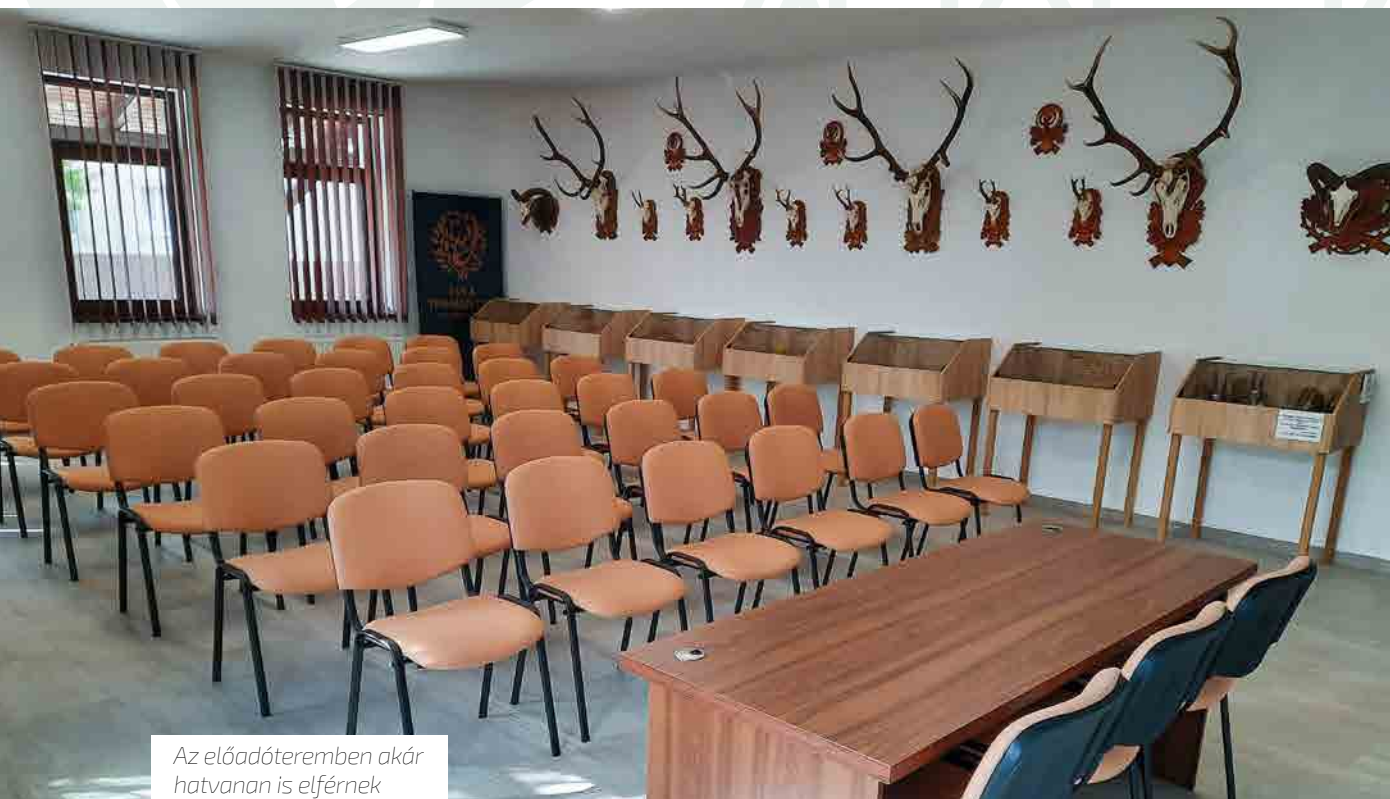
Az előadóteremben akár hatvanan is elférnek

– Az Országos Magyar Vadászkamara munkájában kiemelt szerep jutott az elmúlt években az ifjúságnevelésnek, szemléletformálásnak, érzékenyítésnek, és jelentős részben ehhez kapcsolódóan az infrastruktúra-fejlesztésnek