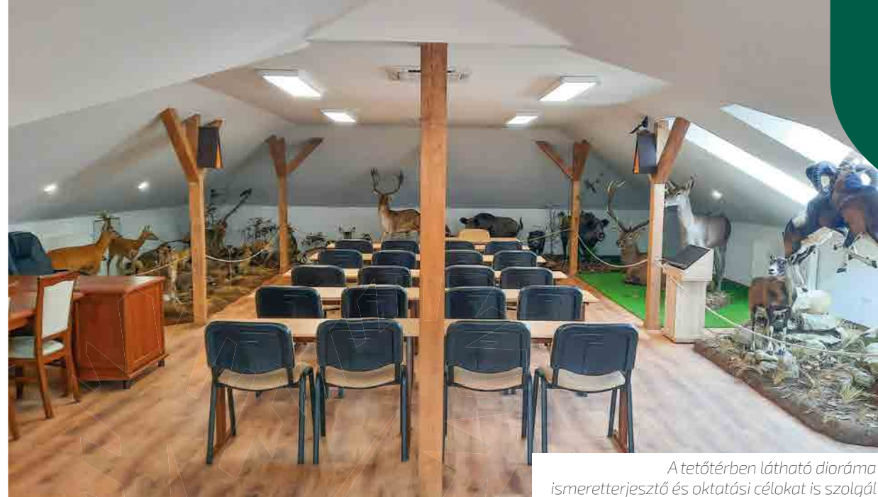
A tetőtérben látható dioráma ismeretterjesztő és oktatási célokat is szolgál

Dr. Semjén Zsolt , a vadászszövetségeket tömörítő Országos Magyar Vadászati Védegylet elnöke üdvözlését, jókívánságait levélben küldte meg, miután miniszterelnök-helyettesi