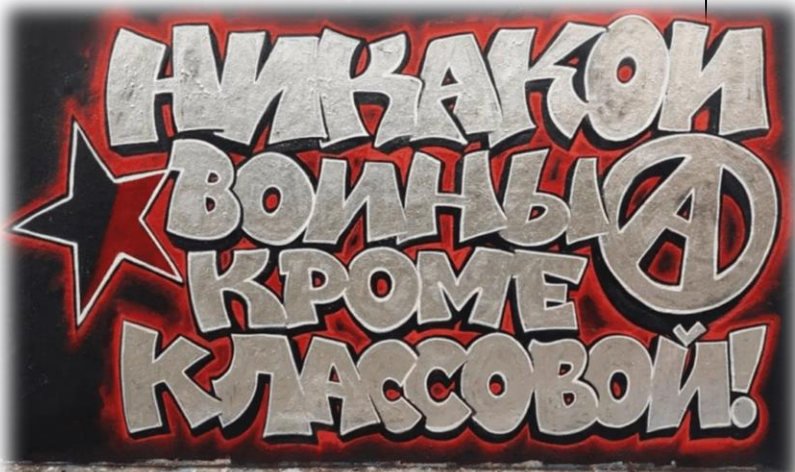
pouliční graffiti v Petrohradu, únor 2022 ŽÁDNOU VÁLKU KROMĚ TŘÍDNÍ VÁLKY

Stejně jako v Íránu, Iráku, Chile, Libanonu, Kolumbii a nedávno i v Kazachstánu je jedinou alternativou pro proletariát v Rusku a na Ukrajině zesílení konfrontace se státem, přímý útok na jeho instituce a vyvlastnění zboží a výrobních prostředků. Neprotestujeme jen v ulicích, ale rozšiřujeme a generalizujeme stávky a rozvíjíme třídní boj na výrobní frontě! Přeměňme boj rodin vojáků, které v minulosti opakovaně projevíly silný