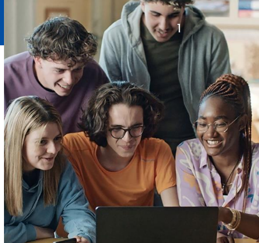
Joc de rols virtual

El Parlament Europeu és l'única institució de la Unió elegida directament per la seva ciutadania. Cada cinc anys, 450 milions de votants elegeixen els diputats i diputades al Parlament Europeu que els representen. Els eurodiputats treballen en nom de la ciutadania debatent, elaborant i aprovant lleis sobre assumptes fonamentals per a la vida quotidiana de les persones. El Parlament: