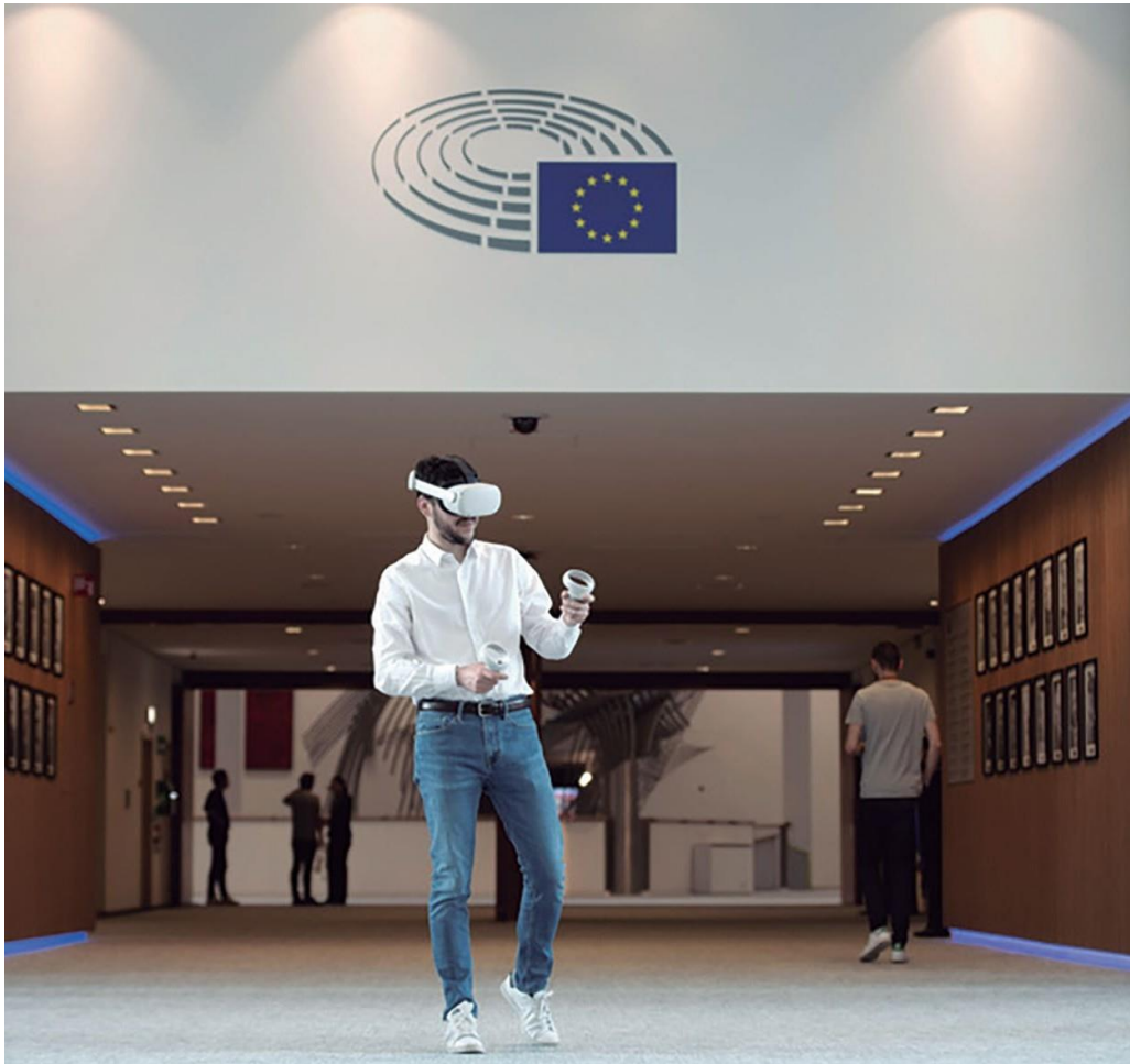
Sigues diputat al Parlament Europeu

En el seu dia a dia, els eurodiputats han de respectar un Codi de conducta que fixa els principis rectors per exercir la seva comesa de manera desinteressada i amb integritat, transparència, diligència, honradesa, responsabilitat i respecte de la dignitat i la reputació del Parlament Europeu. El Codi de conducta es va reforçar el 2023.