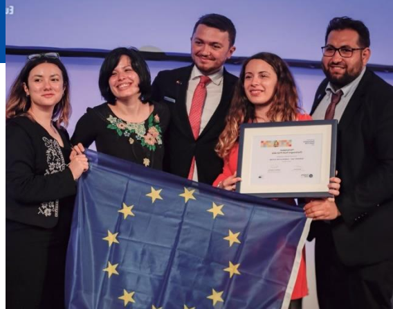
Premi Europeu Carlemany de la Joventut

L'objectiu de l'últim mòdul és oferir a la joventut idees sobre les mesures que pot adoptar per fer un primer pas cap a la ciutadania activa i crear el canvi que vol veure.