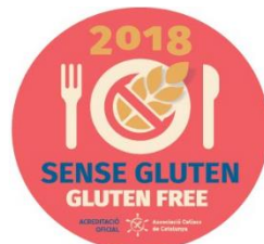
Icona identificativa per

L'adhesiu és vàlid per a l'any en curs , per la qual cosa anualment es faran revisions del procediment que avalin la continuïtat del protocol.