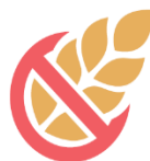
Icona identificativa de Producte Sense Gluten per al Llistat de productes

El distintiu pel producte " Sense Gluten " s'enviarà un cop superada l'acreditació, i a petició del Minorista.