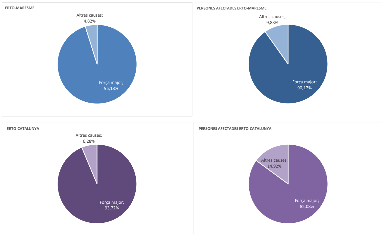
G.1 Percentatge d'ERTO i persones afectades per tipus d'expedient. El Maresme i Catalunya, 12 maig 2020