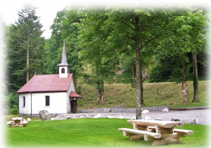
La chapelle Saint-Nicolas