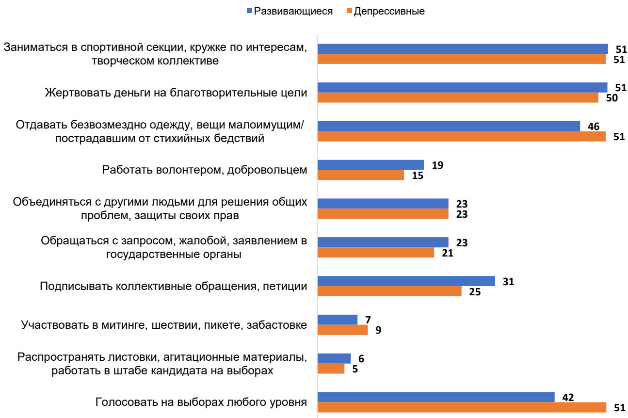
Рисунок 8. Участие в гражданской активности среди городской молодежи России в целом., данные Левада-Центра. Ноябрь 2019 года, молодые россияне 16-34 лет по региону проживания Скажите, пожалуйста, приходилось ли вам за последние 12 месяцев...

Как показывает Рисунок 8, мы не видим ярко выраженных отличий по большинству показателей гражданской активности в зависимости от региона проживания. В депрессивных регионах респонденты более активно голосуют на выборах и более склонны заниматься благотворительностью (отдавать вещи малоимущим). В более благополучных регионах выше уровни волонтерства и число обращений к властям с запросами, жалобами и заявлениями.