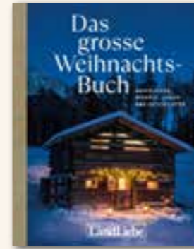
Das grosse Weihnachtsbuch – Bastelideen, Rezepte, Lieder und Geschichten 192 Seiten, Hardcover, CHF 48.– ISBN 978-3-906869-36-0