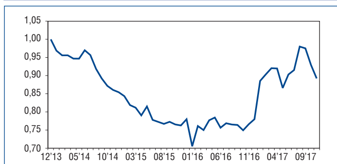
Індекс поточної економічної спроможності

Значення Індексу поточної економічної спроможності станом на кінець 2017р. склало 89,5, що, хоча й суттєво вище від показника кінця 2016р., проте помітно поступається значенням Індексу упродовж липня-жовтня 2017р.