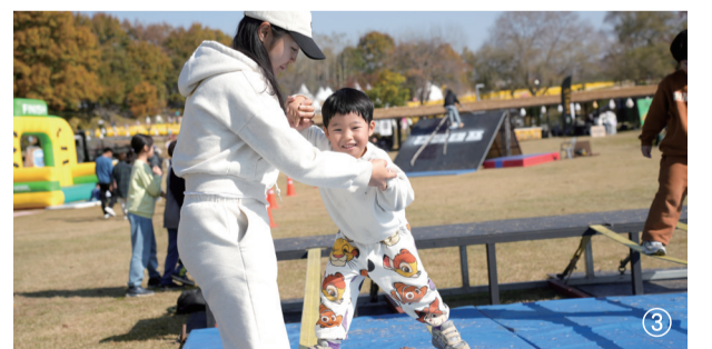
① 장애물 통과 시범을 보이고 있는 <강철부대3> 출연 대원들 ② 조교의 지도 하에 사격 체험을 하고 있는 어린이 참가자 ③ 장애물 통과 체험을 하고 있는 어린이 참가자

2023년 6·25 전쟁 정전 70주년을 맞아 동아일보와 국가보훈부, 연천군이 함께 '제복 영웅을 위한 국민축제 2023 강철 캠프'를 10월 28일 경기 연천군 전곡리 유적지에서 개최했다. 이번 행사는 '대한민국은 제복 군무자를 응원합니다'라는 주제로 군인들의 유격 훈련을 직접 경험해보는 강