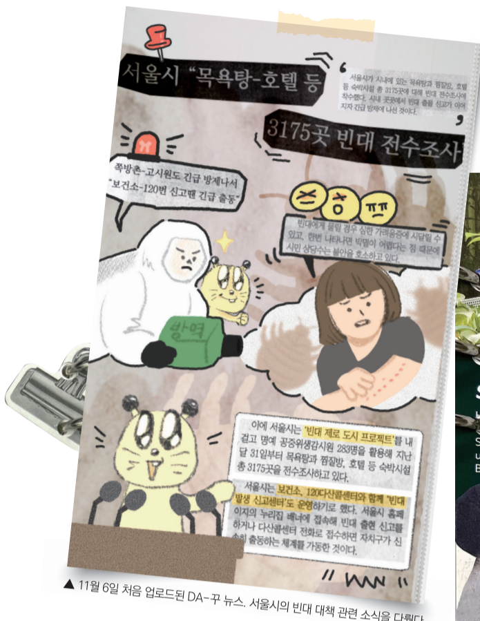
▲ 11월 6일 처음 업로드된 DA-꾸 뉴스. 서울시의 빈대 대책 관련 소식을 다뤘다.

DA-꾸 뉴스는 매일 틱톡을 통해 업로드된다. @da_kku_news, 다꾸뉴스 등으로 검색하면 볼 수 있다. 주말에는 DA-꾸 뉴스의 대표 캐릭터 '얼레'가 따라 하는 최신 트렌드 챌린지 등으로 팬들과 소통한다. '얼레'는 '얼레벌레 다-꾸며벌레'라는 의미를 가진 캐릭터로 얼레벌레 워든 다 하는 성격이다. MBTI는 INTP로, 꾸미고 모으는 등의 다양한 취미를 가지고 있다. 홈프로젝트(백수)로 하고 싶은 일을 찾아가는 중이다.