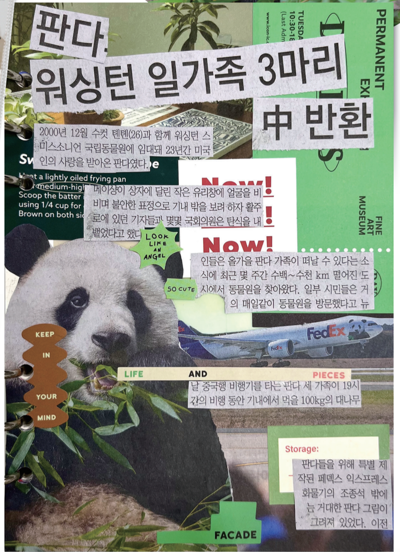
▲ 동아일보 신문 지면을 잘라 꾸미는 방식으로 제작된 11월 10일자 DA-꾸 뉴스.