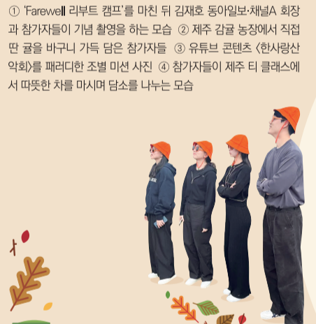
① 'Farewell' 리부트 캠프를 마친 뒤 김재호 동아일보-채널A 회장 과 참가자들이 기념 촬영을 하는 모습 ② 제주 감귤 농장에서 직접 만 곱을 바꾸니 가득 담은 참가자들 ③ 유튜브 콘텐츠 <한사랑산악회>를 패러디한 조별 미션 사진 ④ 참가자들이 제주 티 클래스에서 따뜻한 차를 마시며 담소를 나누는 모습

11월 8일 제주국제공항 앞. 제주의 푸른 바다를 닮은 청명한 가을 하늘 아래 설렘 가득한 표정의 동아미디어그룹(DAMG) 청춘 22명이 모였다. 바로 DAMG 리부트 캠프에 참여한 입사 2년 차 사원들이다. 2022년 상반기 DAMG의 기자, PD, CD, ND 그리고 미디어 경영직으로 각각 입사한 신입들이 약 1년 반 만에 다시 한자리에 모인 것이다.