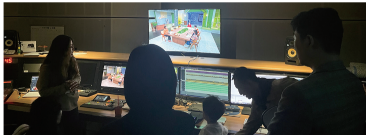
탈북민 출연자와 가족들이 상암동 DDMC를 방문해 〈이제 만나러 갑니다〉 제작 현장을 보고 있다.

“하나의 프로그램을 만들기까지 이렇게 많은 과정과 많은 사람들의 노력이 필요하지 새삼 놀라웠습니다”