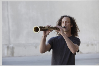
音乐：萨克斯教父归来 《致敬前辈》——萨克斯之父肯尼·基 (Kenny G) 2013中国巡演 演出时间：2013年9月20日 | 演出地点：上海·东方艺术中心

自上个世纪80年代末开始，肯尼·基 (Kenny G) 这个名字就和《回家》、《彼得》等萨克斯经典金曲联系在一起。在中国各地巡演，出访以来，肯尼·基总计创造了九张白金全美当代爵士乐销量并打造过专辑榜 TOP10 冠军专辑，拥有24张畅销 TOP40 单曲。历年的专辑、单曲、音乐录影带的累积销量也突破7500万张。他是流行音乐史上最畅销的演奏家之一，同时也是当代最畅销的爵士乐手，曾获得格莱美奖、全美音乐奖、灵魂列车奖、世界音乐奖。 在肯尼·基出现之前，萨克斯风一直是流行乐坛的配角，1987年，他的畅销单曲《Songbird》让全球迅速喜欢上萨克斯风这个乐器，萨克斯风正式跃升为流行乐坛的主角，不仅法兰克·辛纳屈、詹姆斯·史提华、埃琳·凯、詹姆斯·泰勒等爵士乐坛巨星争相演奏萨克斯风，就连美国前总统克林顿对他的演奏才华更是大加赞扬。其中一位重量级的音乐家甚至称他为“萨克斯之王”。去年，他完成北美巡演飞到巴黎为好友地制作《十二生肖》音乐会，该计划在巡演结束后乐坛继续演奏，足证其地位超然。