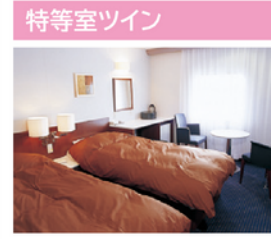
お二人の船旅を印象的に演出するツインルームです。洋室タイプと和洋室タイプをご用意しています。

定員・部屋数 定員：2名 客室：22室 設備 テレビ・テーブル・椅子・洗面台・クローク