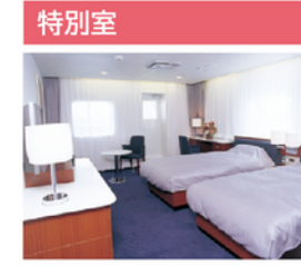
ホテルのスイートルームのような優れた居住性とシックなインテリア。プライベートデッキからは外海が望め、優雅な豪華客船のクルーズを演出します。

定員・部屋数 定員：1名 客室：4室 設備 テレビ・冷蔵庫・クローク・ユニットシャワー・トイレ