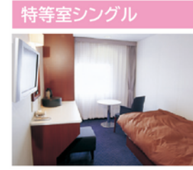
アーバンホテルの高級感をたたえるくつろぎを重視した気取らない空間は、スタイリッシュなOne Dayクルーズを演出します。

定員・部屋数 洋室タイプ：定員：2名 客室：4室 和洋室タイプ：定員：2(3)名 客室：2室 設備 テレビ・冷蔵庫・クローク・ユニットシャワー・トイレ