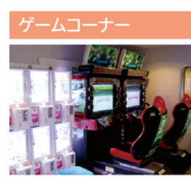
子供から大人までお楽しみいただける最新のゲーム機を設置致しております。船旅の気分転換にご利用ください。