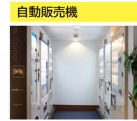
ドリンク以外に軽食も完備しております。