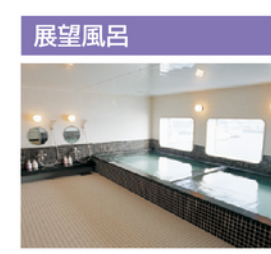
開放感溢れる展望風呂は、旅の疲れを癒してくれます。海の上でのバスタイムは気分も別格です。