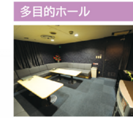
海の上、いつもと違う空間で。少人数のセミナーや研修など様々な用途にご利用いただけます。※有料(事前のご予約が必要です。お問い合わせください。)