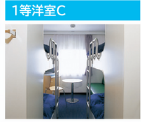
シンプルで明るい空間は4人までの“楽しいグループ旅行”に最適です。

定員・部屋数 定員：4名 客室：12室 設備 テレビ・テーブル・椅子・洗面台・クローク