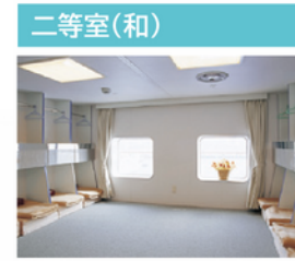
フレキシビリティとプライバシーを兼ね備えた斬新な空間は、“進化するカジュアルクルーズ”をご提供します。