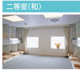
フレキシビリティとプライバシーを兼ね備えた斬新な空間は、“進化するカジュアルクルーズ”をご提供します。