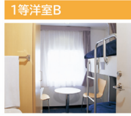
機能性を集約させた一体感のある空間は、プライバシーを重視した高い居住性を保ちます。

定員・部屋数 定員：4名 客室：12室 設備 テレビ・テーブル・椅子・洗面台・クローク