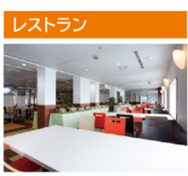
和洋食はもちろん、ニューかめりあならではの韓国料理を提供する、本格派レストランです。