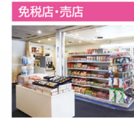
お酒、たばこ、化粧品、おみやげ品と日用雑貨の販売をしております。国際フェリーならではの、免税店で充実の品揃え、ゆっくりとお買い物をお楽しみ頂けます。