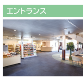
いつでも自由にくつろげる空間をご用意。大型フェリーならではの開放感をお楽しみください。