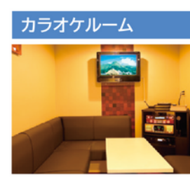
大人気で盛り上げられます。船旅の気分転換に。※有料(事前のご予約が必要です。お問い合わせください。)