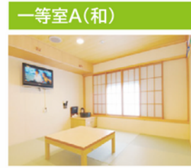
のびのびとした居心地のよい空間は、日本的な安らぎを演出し、“お子様連れの家族旅行”等に最適です。

定員・部屋数 定員：4~5名 客室：21室 設備 テレビ・テーブル・洗面台・押入れ