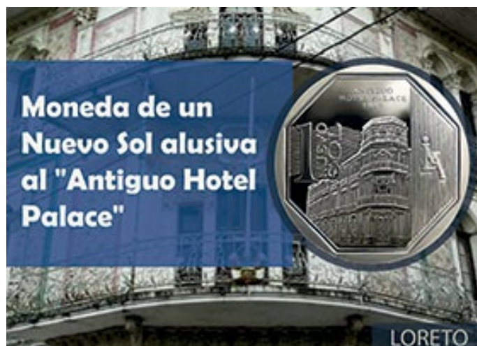
MONEDA ALUSIVA AL “ANTIGUO HOTEL PALACE”

El inmueble fue declarado Patrimonio Cultural de la Nación por Resolución Ministerial N° 793-86-ED del 30 de diciembre de 1986. Actualmente es sede de la Comandancia General de la Región Militar del Oriente.