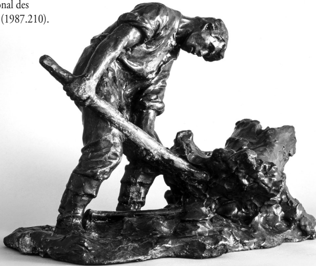
Figure 6 Suzor-Coté, L'Essoucheur , 1926?, plâtre teinté, 39 x 31,8 x 56,8 cm, collection Musée national des beaux-arts du Québec (1987.210).

Dans le passage de l'illustration bidimensionnelle sur papier à la ronde-bosse, les sujets passent de l'individualité à la fonction qu'ils occupent dans le roman et ils se rapportent alors à un type de travailleur associé à la race canadienne-française. Par ce changement de médium, Suzor-Coté métamorphose les figures littéraires en portraits de genre. Le personnage de François Paradis devient le prototype du portageur, alors que la force herculéenne qui caractérise Edwidge Légaré (fig. 5) lui permet d'incarner l'attitude de tous les bûcherons et de tous les défricheurs. Tir'Sèbe se glisse sous les traits du remmancheur, alors que le médecin et le vieux fumeur, représentations anonymes dans le roman, accèdent par leur caractère générique à l'expression emblématique de cette profession ou de cette occupation.