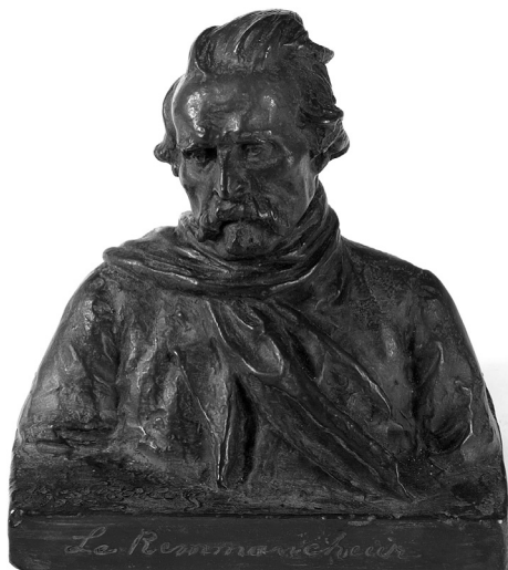
Figure 3 Suzor-Coté, Le remmancheur , 1928, bronze, 22.9 x 19 x 12.7 cm, collection privée. (Photo: Gracieuseté de la Maison Heffel).