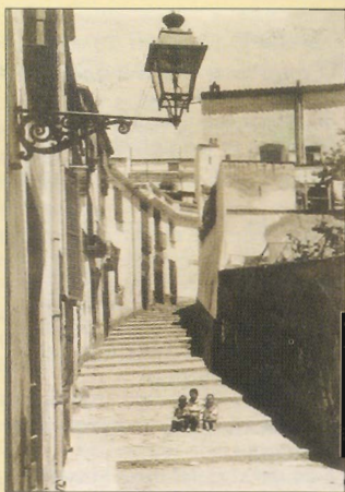
La davallada del carrer d'Avall, l'any 1930

L'altre casal, en el núm. 7, és can Pasqual , família de constructors navals i comerciants dels segles XVI i XVII, ennoblits posteriorment, un dels membres de la qual, l'arenyenc Antoni Pasqual i Lleu (1643-1704), va ser bisbe de Vic.