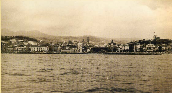
Vista d'Arenys des del mar, el 1949