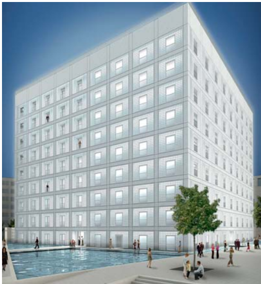
Die neue Bibliothek öffnet im Jahr 2011 am Mailänder Platz.