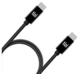
tizi flip USB-C