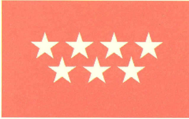
Diseño de la Bandera de la Comunidad de Madrid