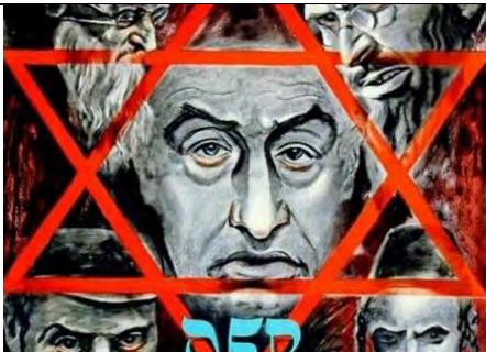
Der ewige Jude