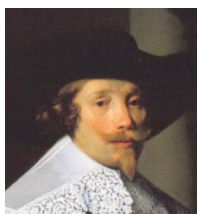
Figuur 6 Cornelis de Graeff, detail

Omdat politieke macht een belangrijke factor is, ligt het voor de hand belangrijke figuren uit het bestuurlijke echelon van Amsterdam in de Gouden Eeuw als onderzoeksobject te kiezen. In dat geval