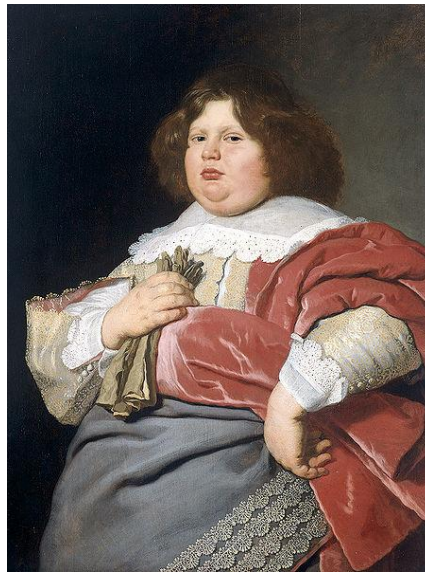
Figuur 3 Gerard Andriesz Bicker, 1640-52 Bartholomeus van der Helst

Wat Amsterdam ook uitermate geschikt maakt om te onderzoeken zijn de turbulente politieke gebeurtenissen vanaf de alteratie tot eind zeventiende eeuw. De worsteling om onder het Spaanse juk uit te komen, de machtsstrijd tussen de Oranjes en de regenten, de godsdienstige schermutselingen en de internationale handelsoorlogen vergden veel van de politieke bestuurders. Afkomst en geboorte, zoals bij de adel, legden geen gewicht in de schaal om politiek succesvol te zijn. Alleen diegenen die beschikten over scherpzinnigheid, tactisch inzicht en uitstekende sociale vaardigheden konden zich manifesteren als vooraanstaande leden van de elite. Andries Bicker en Cornelis de Graeff, die meerdere malen magnificus (presiderend burgemeester met een doorslaggevende stem) waren, werden geroemd om hun tact, inventiviteit en de geslaagde samenwerking met Raadspensionaris Johan de Witt. Natuurlijk waren familierelaties ook een belangrijk bij de keuze van kandidaten, iedere familie probeerde eigen leden te benoemen, maar het was niet onmogelijk als relatieve buitenstaander deel te nemen aan het bestuur.