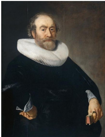
Figuur 4 Andries Bicker 1642, Bartholomeus van der Helst

Amsterdam ontwikkelde zich in de zeventiende eeuw van een stad met een lokale oriëntatie naar een stad die de wereld beschouwde als haar handelsterrein. De leden van de Amsterdamse elite gedroegen zich navenant, wat onder meer culmineerde in de bouw van het Amsterdamse stadhuis, dat de allure had van een paleis. Maar ook lieten de regenten meer dan ooit via uiterlijk vertoon zien dat zij trots waren op hun positie. De bouw van rijk gedecoreerde patriciërshuizen waren schering en inslag voor diegenen die zich wilden voorstaan op macht en rijkdom. De woningen van de Bartolotti's, De Graeff, en de gebroeders Trip zijn hiervan slechts enkele voorbeelden. Ook in de geschilderde portretten van vooraanstaande burgers is de modeontwikkeling te zien; de aanvankelijk enigszins sobere kleding maakt in de loop van de zeventiende eeuw plaats voor rijke uitdossingen.