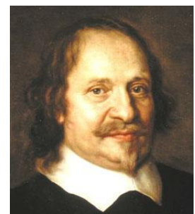
Figuur 5 Andries de Graeff Govert Flinck, ca 1650

komt men niet om de namen heen van Bicker en De Graeff; twee families waarvan leden decennialang zitting hadden in de Vroedschap en vele malen als burgemeester functioneerden. Bovendien waren beide families door huwelijken nauw gelieerd. In de eerste helft van de zeventiende eeuw waren Andries Bicker en Cornelis de Graeff elk liefst tien maal burgemeester. 10 Na het overlijden van Cornelis in 1664 kwam zijn twaalf jaar jongere broer