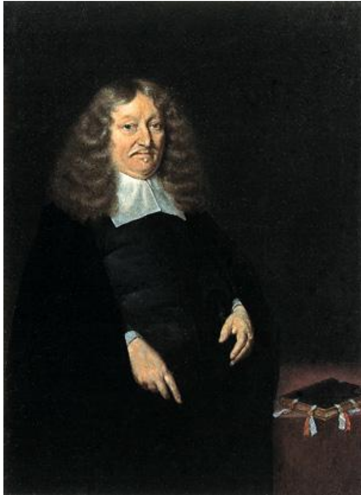
Figuur 1 Andries de Graeff Gerard ter Borch II, 1674 41 x 30 cm, privébezit Olieverf op doek