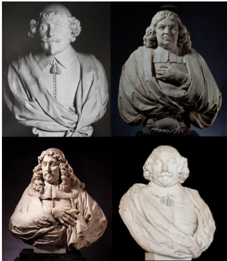
Figuur 2 Met de klok mee vanaf links onder de burgemeesters A.de Graeff, N.Tulp, J.Munter, N.Witsen

Wie het geluk had om in 2004 – voor de restauratie - het Paleis op de Dam te bezoeken, heeft in de Burgerzaal een aantal marmeren bustes gezien. De kwaliteit van deze beelden en de allure van de twee verdieping hoge ontvangstruimte doen de bezoeker al heel snel vermoeden dat het hier om hooggeplaatste personen gaat. Het waren inderdaad portretbustes van Amsterdamse burgemeesters zoals De Graeff, Munter, Tulp en Witsen die zich als Romeinse senatoren lieten afbeelden. En juist dit soort figuren interesseren ons, zowel in historisch opzicht als ook vandaag de dag, getuige de enorme populariteit van de glossy societytijdschriften en dito columns in kranten.