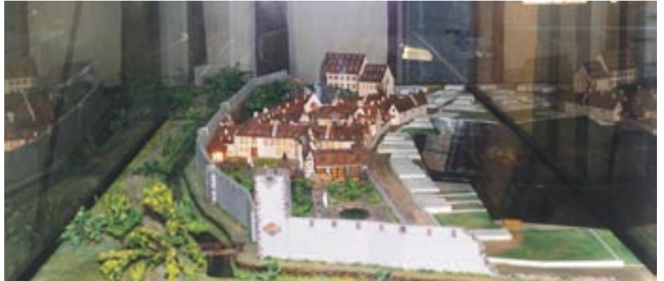
Maquette de la Chartreuse.