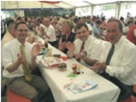
La table des officiels, le maire de Molsheim et l'ancien et le nouveau maire de Gerbrunn.

Tout au long de 2007, Gerbrunn, la ville de Bavière jumelée avec Molsheim fête avec éclat son 900 ème anniversaire.