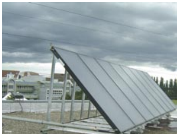
Panneaux solaires installés sur le toit de la résidence.

Cette phase est plus longue, elle s'articule en deux étapes, chaque aile était traitée à part.