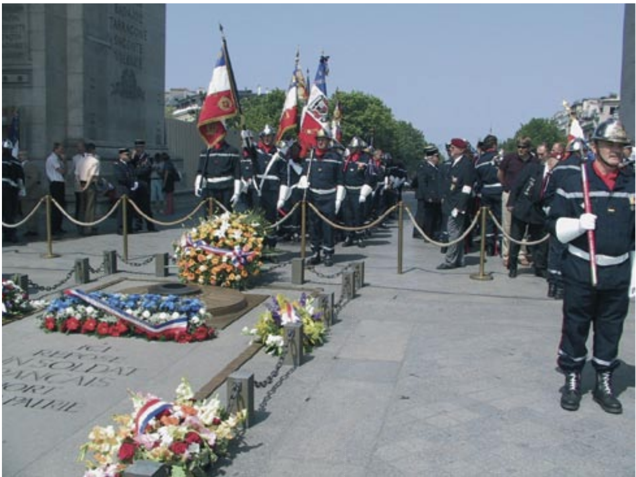
La garde devant l'Arc de Triomphe à Paris.

La décennie suivante sera celle de l'achat d'un véhicule de secours aux asphyxiés (VSAB) et blessés, d'un camion citerne de 3 000 litres. Par la suite, se concrétise également la notion de désincarcération. Une échelle pivotante automatique (EPA) de 30 mètres viendra compléter le parc de matériel en 1977. Tous ces nombreux équipements justifient donc la construction, en 1980, d'une nouvelle caserne rue Henri Meck, où d'ailleurs elle se trouve encore de nos jours. Depuis cette date, le Centre a été le siège de nombreuses mutations techniques et administratives, dont l'intégration au SDIS (Service Départemental d'Incendie et de Secours), ce qui a eu pour conséquence, pour Molsheim, le transfert de la compétence incendie de la Ville au Département. Mais la devise des valeureux pompiers «Courage et Dévouement» n'a heureusement pas changé et ils répondent toujours présents de jour et de nuit, lorsqu'il s'agit de secourir les personnes et de préserver les biens.