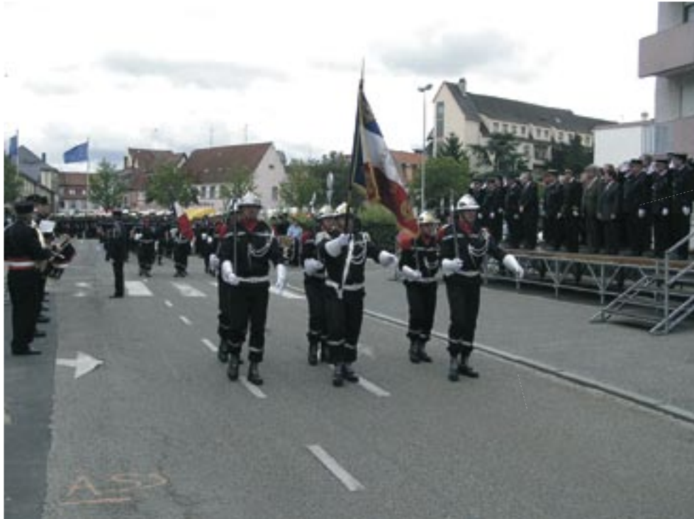
Défilé de la garde.

Lors de la dissolution de la garde nationale en 1852, la compagnie éclata en quatre divisions, dont chacune