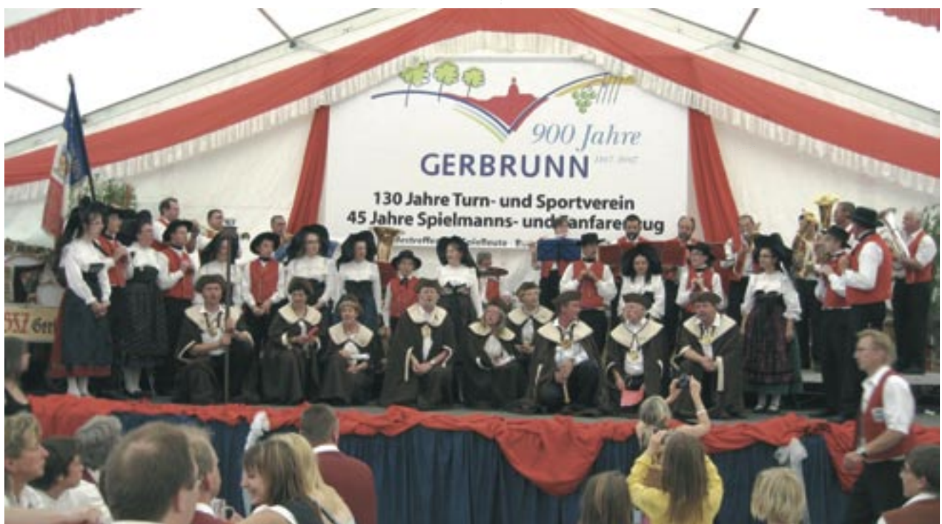
Arts et loisirs et les Kaffeibich sur le podium.