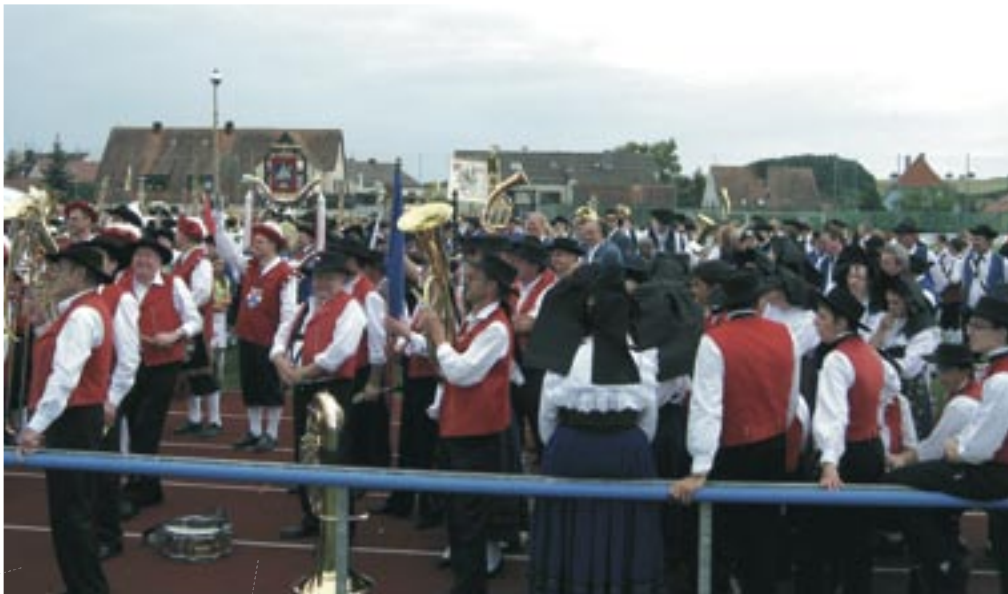
Les musiciens rassemblés sur le stade.

ball permet aux 1 000 musiciens présents d'interpréter les divers hymnes nationaux et régionaux.