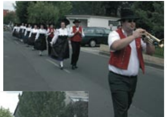
Arts et loisirs, et Kaffeebich dans le défilé.

Bien que les festivités d'anniversaire avaient déjà officiellement débuté le 19 juin, le 1 er juillet constitua tout de même le summum de la fête. Ce jour, on observa un cortège de 60 so-