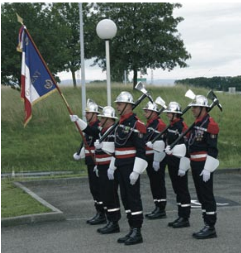
La garde en manoeuvre.

desservait une pompe de campagne. Une section de musique fut créée en 1859. Entre 1870 et 1918, le Corps des Sapeurs-Pompiers, commandé par le Commandant Rollin, connu de nombreux changements : les armes leur sont retirées en 1907 et les effectifs diminuent sensiblement pour tomber à 85 hommes en 1913. En 1938, l'année de l'arrivée de la grande échelle et de deux moto-pompes, ils ne sont plus que 55 personnes. Sous l'occupation, le Corps des Sapeurs-Pompiers se voit doter d'un premier fourgon-pompe équipé d'une pompe aspirante et refoulante d'une puissance de 90 m 3 /heure. Elle interviendra lors de grands feux, à Molsheim et à Altorf, ainsi que lors des bombardements de 1943.