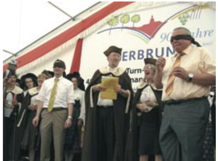
Intronisation du maire de Gerbrunn et de son adjoint.