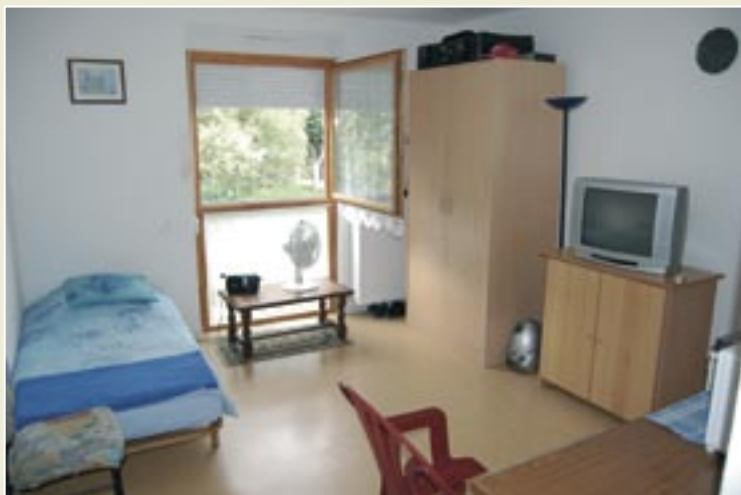
Chambre meublée de la nouvelle aile.