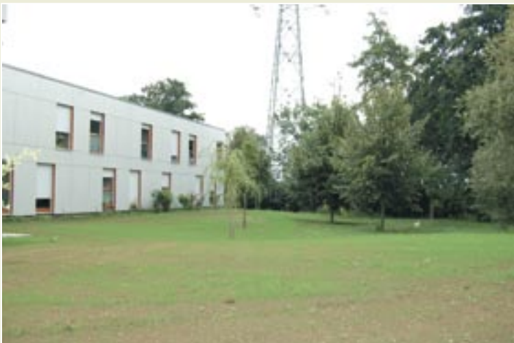
Aile nouvelle réalisée en 2005-2006.

Le bardage est recouvert de panneaux qui protègent cette ossature. Les studios sont confortables et donnent sur un espace vert agréable.