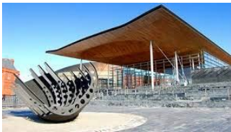
Cynulliad Cenedlaethol Cymru, Caerdydd