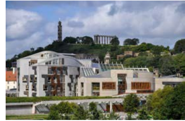
Senedd yr Alban, Caeredin