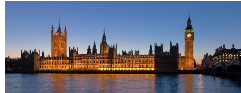
Senedd y DU, Llundain