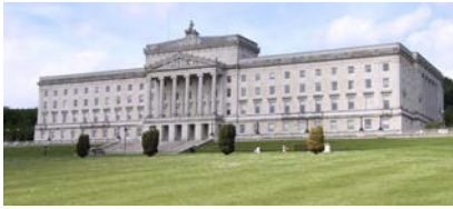
Cynulliad Gogledd Iwerddon, Belffast