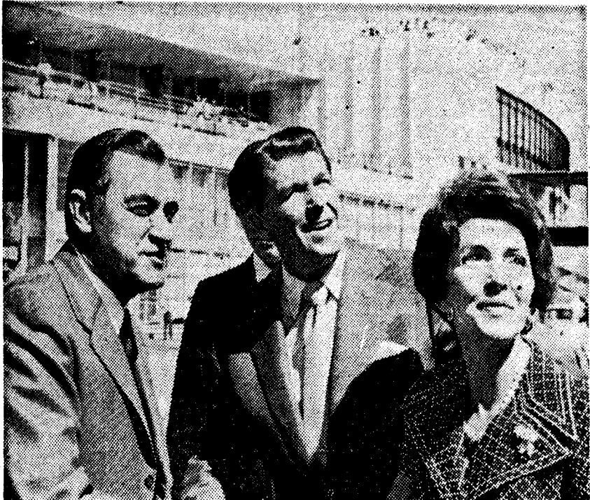
El enviado especial del presidente Nixon, senador por California, Ronald Reagan, a su llegada al aeropuerto de Barajas

«Mi visita subraya la importancia que el Gobierno de los Estados Unidos da a sus relaciones de cooperación con sus amigos europeos», declaró el gobernador de California, Ronald Reagan