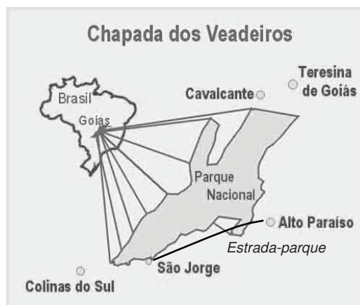
Figura 3. Mapa modificado para ilustrar a Região da Chapada dos Veadeiros – GO, com a Estrada-Parque Fonte: http://www.viaecologica.com.br/guiaecologicos/veadeiros/imagens/mapas/veadeiros.htm :

Nesta região está sendo implantada uma estrada, denominada “Estrada-Parque Chapada dos Veadeiros”, que liga Alto Paraíso de Goiás ao município de Colinas do Sul passando pelo distrito de São Jorge, com 72 km de extensão. Em novembro de 2005, havia sido asfaltados 28 km, restando 13 km para a pavimentação até São Jorge.