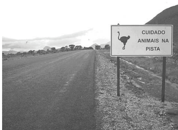
Figura 4. Vista Estrada-Parque – Placas de Sinalização.

A definição de Estrada-Parque feita por Da - Ré e Arcari (apud Silva 1996), citada anteriormente, quando comparada às Estradas-Parques do modo existente no Brasil, provoca indagações sobre este termo. A “Estrada-Parque Chapada dos Veadeiros”, em processo de implantação desde 2004, não atende às especificações feitas pelo autor. Por exemplo, a definição “alto valor educativo”, supõe que os transeuntes deveriam respeitar as normas estabelecidas na estrada, não existe neste caso, pois, segundo relatos da comunidade residente em seu entorno, constantemente observa-se atropelamentos de animais, apesar da existência de placas de sinalização ao longo da estrada: “canso de ir a Alto Paraíso e ver animais mortos na estrada...” (sic) 7 , “trafego de bicicleta diariamente, por esse trecho e encontro muitos animais mortos pela estrada” (sic) 8 . Como pode então ser considerada como de alto valor educativo?. Figura 4.