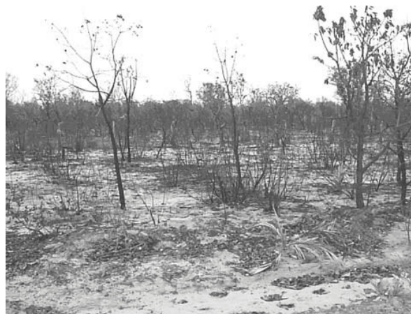
Figura 7. Vegetação queimada no entorno da estrada de São Felix do Tocantins a Mateiros.

A transformação da estrada São Felix a Mateiros, com extensão de 60 km, em Estrada-Parque (única via de acesso para as comunidades da região), poderia resguardar as paisagens cênicas ao seu entorno, pois se considerada UC, surgirá restrições de uso do solo em sua proximidade, o que colaboraria para a diminuição das queimadas e ajudaria na conservação do ambiente.