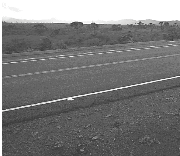
Figura 5. Vista Estrada-Parque – Ciclovia. Fonte: Autoria própria.

Ao percorrer trechos já pavimentados dessa estrada, verifica-se a existência de uma ciclovia que não oferece segurança aos ciclistas, pois é uma faixa estreita, também utilizada como acostamento de carros, “No projeto divulgado, havia um corredor verde entre a rodovia e a pista de ciclismo. Não foi feito a estrada que foi colocada no telão, não há sinalização adequada e o ciclista não obedece à faixa dos carros e vice-versa” (sic) 12 . Outra característica observada é a erosão nas proximidades da própria margem da rodovia, o que demonstra que não foi feito um trabalho de recuperação no entorno desta. O EIA/RIMA, segundo o gerente do Parque Nacional da Chapada dos Veadeiros, não consta o que deve e o que não deve ser feito no entorno da estrada, no que diz respeito a sua conservação, manutenção e cuidados com a biodiversidade existente.