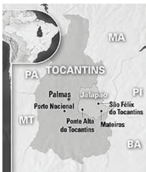
Figura 1. Mapa ilustrativo de localização da Região do Jalapão – TO

O Jalapão está localizado na região leste do Estado do Tocantins, tendo como portal de entrada Ponte Alta do Tocantins, distante aproximadamente 200 km da cidade de Palmas, capital do Estado. A região do Jalapão abrange os municípios: Ponte Alta do Tocantins, Mateiros, São Felix do Tocantins, Rio do Sono, Lizarda, Lagoa do Tocantins, Santa Tereza do Tocantins e Novo Acordo. Figura 1.