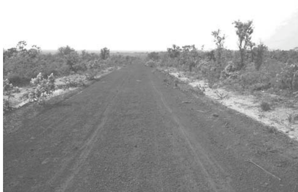
Figura 6. Estrada entre os municípios.

A transformação desta estrada em uma UC poderá gerar também conflitos com as cinco comunidades locais (Prata, Sussuapara, Galheiros, Fazenda Nova e do Carrapato), pois elas não foram informadas sobre o que seria uma estrada parque e vêem na convencional pavimentação da estrada uma perspectiva de melhoria de vida. Segundo relatos da comunidade, “... o asfalto melhoraria o transporte...” (sic) 15 .