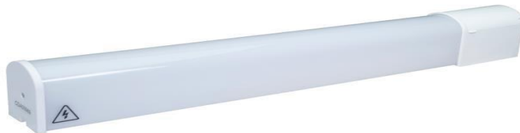
FLAVIA Applique LED 9W avec prise 2P+T Référence 313910 - EAN 3233550313918 Modèle W490S50-4F-8W