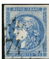
Type II, n° 45