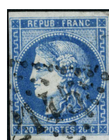
Type III, n° 46