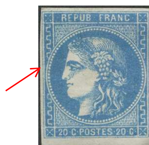
Type III, n° 46