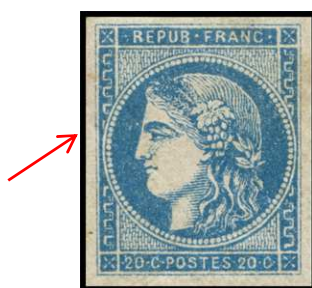
Type II, n° 45

C'est la différenciation entre type II et type III qui semble poser le plus de problèmes aux collectionneurs et les catalogues ne leur sont pas d'un grand secours.