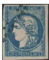
Type I, n° 44

Leur identification est parfois difficile pour des collectionneurs désemparés au vu des indications des catalogues.