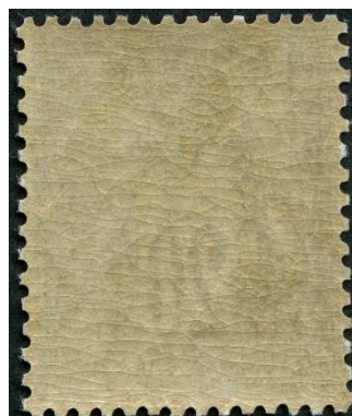
Gomme timbre faux

La gomme du faux paraît suffisamment vieille pour tromper bien des collectionneurs.