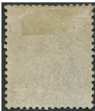
Gomme timbre authentique

L'examen de ces images agrandies confirme les défauts constitutifs de la méthode du faussaire. Les feuilles de la branche tenue par l'allégorie de la Paix présentent les mêmes défauts de graphisme que les autres parties précédemment montrées.