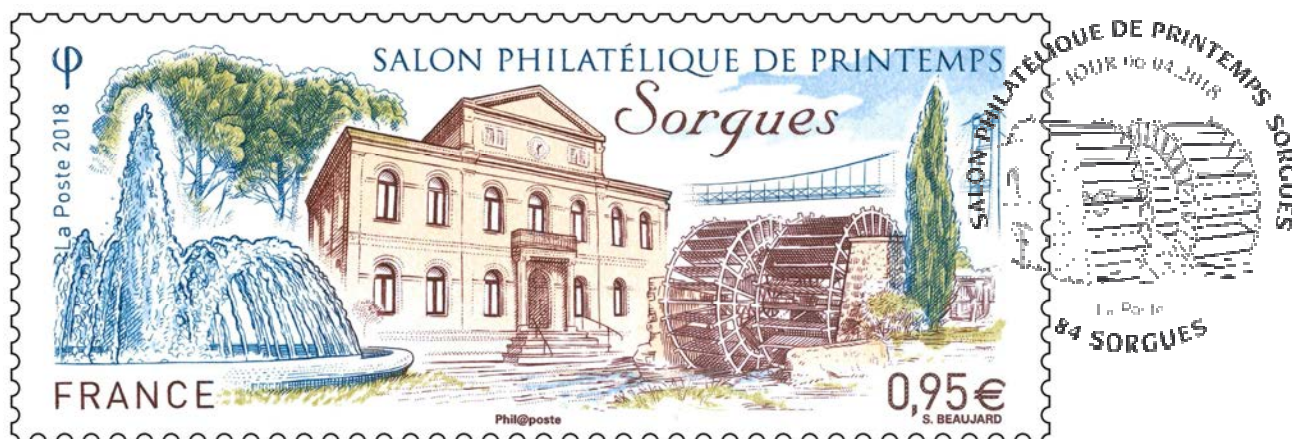
Visuel d'après maquette/ disponible sur demande

Un timbre en taille-douce « SALON PHILATÉLIQUE DE PRINTEMPS Sorgues ».