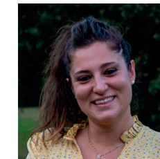
Beatrice Cabella Assessore uscente alle Politiche Sociali