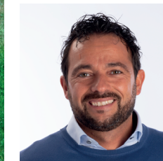
Armando Sanna Sindaco uscente dal 2014 al 2020 Vi Presidente del Consiglio Regionale