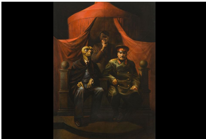
Komar and Melamid - "Yalta Conference" (Study), 1982 - Oil on canvas, 36 x 24 inches

конференции, Ялта, 1945». В левом верхнем углу: «Дизель, для успешной жизни».