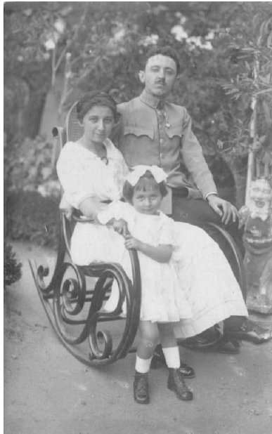
Familia Pinte în 1916