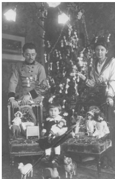
Familia Pinteș, Craciun 1916