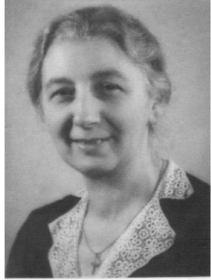
Valeria Pinteș, 1939