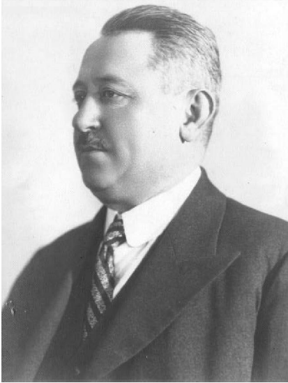
Vasile Pinteș, 1939