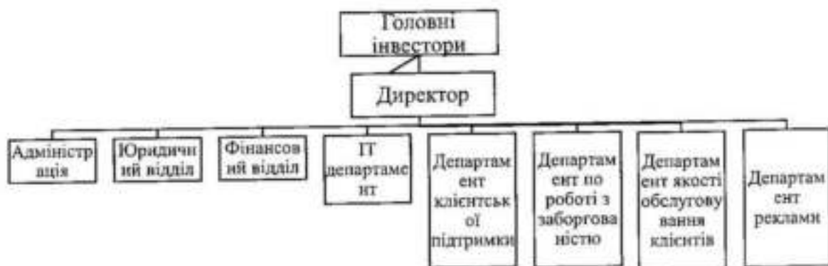
Рисунок 1 – Лінійна структура управління підприємством ТОВ «Алекскредит»

Товариство обрало саме цю структуру за її властивість чітко здійснювати принцип єдиноначальності: кожен підрозділ очолює керівник, наділений усіма повноваженнями, який здійснює одноособове керівництво підлеглими йому ланками і який зосереджує у своїх руках усі функції управління. Керівники підрозділів нижчих ступенів безпосередньо підпорядковуються тільки одному керівнику більш високого рівня управління, вищий орган управління не має права видавати розпорядження виконавцям, минуючи їхнього безпосереднього керівника. Даний вид структур характеризується одномірністю зв'язків: тут мають місце тільки вертикальні зв'язки.