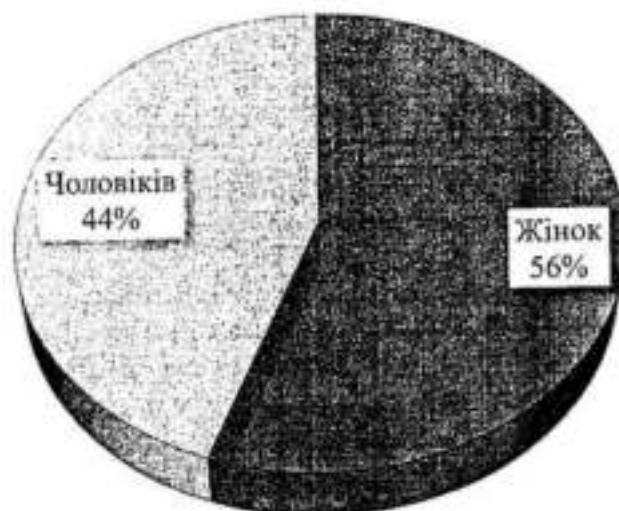
Діаграма 1 – Гендерна структура співробітників ТОВ «Алекскредит»

Слід зауважити, що в кадровій політиці Товариство не має гендерного нерівноправ'я. Про це свідчить майже половина осіб жіночого полу, які займають керівні посади.